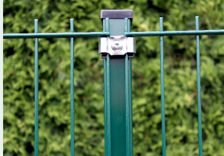
Pfostentyp WS- VA