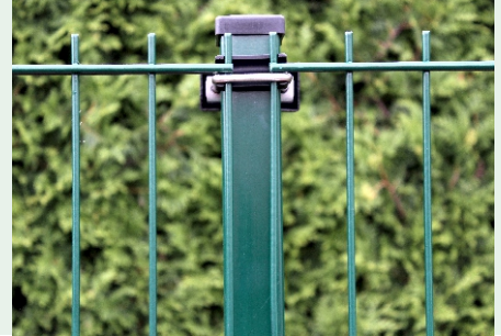
Pfostentyp WS- U- VA