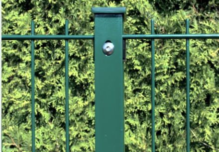
Pfostentyp WS- FA