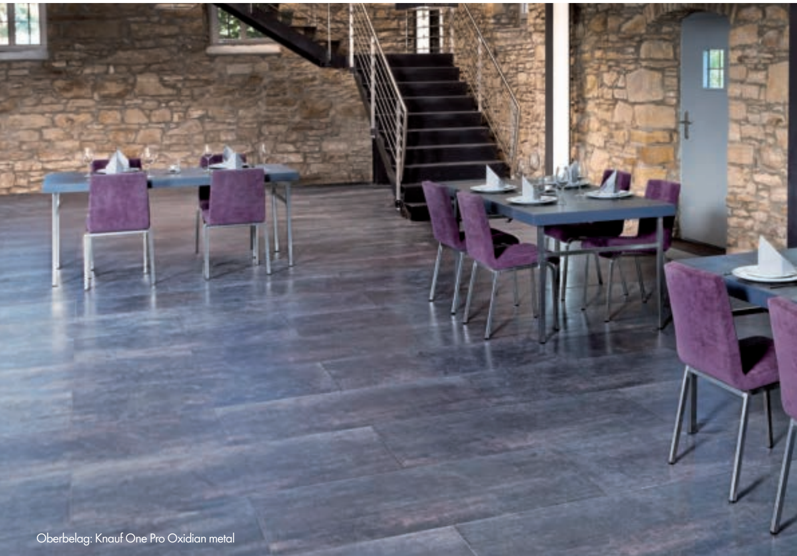
Oberbelag: Knauf One Pro Oxidian metal