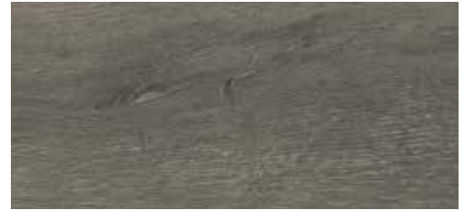
Steineiche La Palma