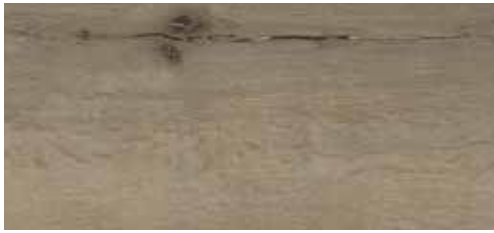
Eiche Gran Canaria