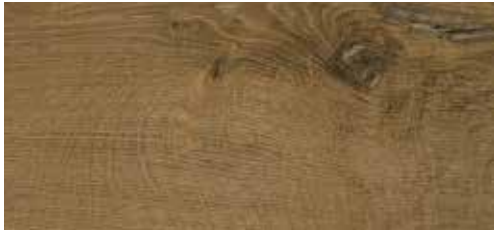
Ulme La Gomera